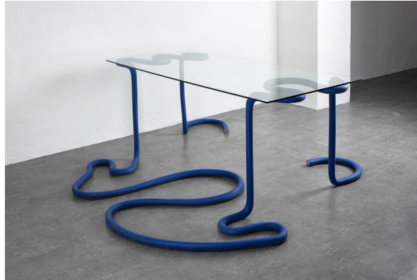
Mono © Jeong Greem